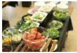
サラダビュッフェ