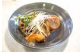
豚バラ肉と大根の角煮

桜吹雪の舞散る4月1日、京王・小田急永山駅から徒歩7分、Brilia多摩ニュータウン内に和食とサラダビュッフェのお店『WAS CAFE』がオープンしました。