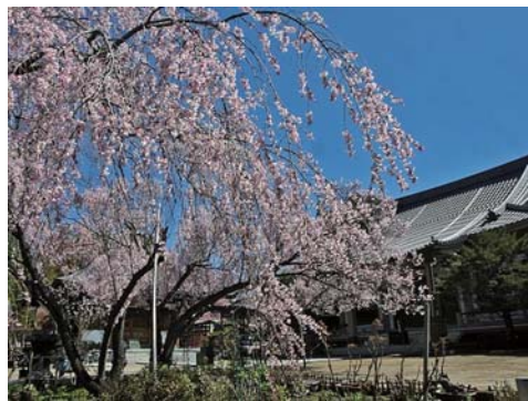
吉祥院の美しいしだれ桜

日時: 4月8日(土) 10:00~17:00 場所: 吉祥院 多摩市豊ヶ丘 1-51-2 TEL 042-374-2871