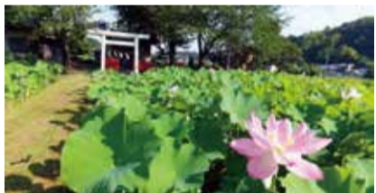
↑ハス田のそばにある小山田神社

大賀藕絲館から少し離れた所にハス田があります。このハス田は観光用のハス田ではなく、町田市の大賀藕絲館が、館内で作成する手工芸品の材料にするために、大賀ハスの栽培、管理を農家に依頼しているハス田。 町田市の大賀藕絲館は1979年、当時の町長大賀正町市長が、大賀一郎博士著「ハス」にヒントを得て、藕絲織を障害のある人たちの仕事とする職場作りを目指して開設したのが始まりで、現在は社会福祉法人「まちだ育成会」の運営となっています。 観賞の際はルールを守って農家の方にご迷惑がからないように気を付けてください。 (駐車場や車を停めるスペースはありません)