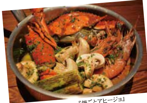
『鍋ごとアヒージョ』