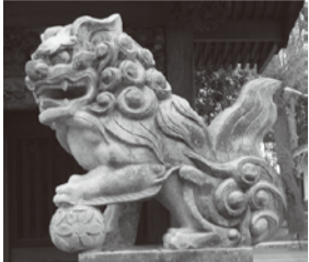
武蔵国一宮「小野神社」(多摩市)

今年も多くの方が初詣に行かれたと思いますが、神社(寺院)の魔除けとして、にらみを利用し守っている狛犬にお気づきでしょうか? この狛犬…みんな同じようにみえますが、どうしてとてつとも個性豊かなんです。