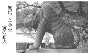
「鞍馬寺」金堂 寅の狛犬