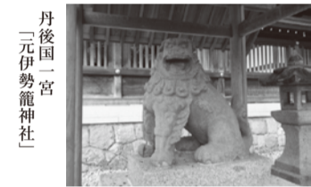
丹後国一宮 二元伊勢籠神社