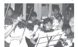
Pizza&Spaghetti『ハウスリーク』さんにて(落合)

「多摩ユースオーケストラ」の有志10名による2回のステージ、ログハウスの店内には弦楽器の調べがびびり...『ハウスリーク』さんの20周年記念コンサートにふさわしい素敵なディナータイムとなりました。