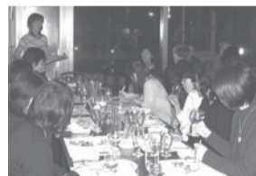
カフェレストラン『リパゴージュ』さんにて(乞田)

“ブルゴーニュとボルドーのちがいは” “オードブルとチーズの相性” などオーナーご夫妻によるおはなしがステキ! ワインについての知識が深まりました。