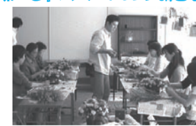
ASAニュータウン永山店およびイワオフリースペースにて

春のお花でつくるアレンジメントに挑戦、バスケット一杯に彩られた作品の豪華さに感激! 図解入りのテキストが自宅での応用にも役立ちました。