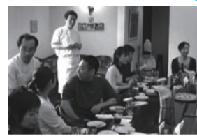
ピッツェリア『ラ・パラー』さんにて(山王下)

ピッツァの歴史を紐解くお話からスタート、あつあつのピッツァが食べ放題、微発泡性ワインも飲み放題、昼下りの豪快なひと時に感謝します。