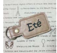
完全オリジナル キーホルダーmini…¥1500