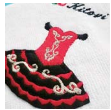
今治タオル パレエ・キトリのアップリケ…¥1500