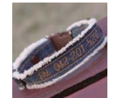
名前と電話番号お入れします。 デニムのペット用首輪…¥4900