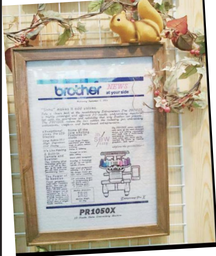
“これはすごい! 文字もミシン模様も、すべて刺繍。本物の英字新聞みたい!”