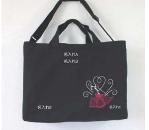
名入れ無料 【レッスンバッグ】フラメンコ…¥4900

◇こんなものがあつたら良いのに…これが刺繍だったら良いのに…そんな気持ちを形にしていきたいと思っています。“道しるべ”もなく“道なき道”を切り拓くような孤独感がありますが、イメージが徐々に形になっていく過程はとても楽しくて夢中になって取り組んでいます。