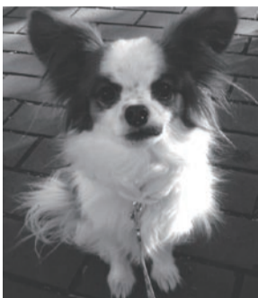
6/25号に登場した『ピンキーちゃん』のお友達です。

わが家のおてんば娘『ミニちゃん』(パピヨン6歳)です。体重3キロ、美容と健康のため、シラス・カズビ海ヨーグルトなど、毎日のお食事にも気を遣って太らないようにしています。(^^)名前を呼ばれると喜んで突進しますが、呼んだ人の手前で鼻をかわし何事もなかったかのように振舞います。怒ると吠えながらくるると回ります。肩が軽いので高い所に上るのも得意ですが、2歳の時に落してしまいました。いまも元気な長生きですね。