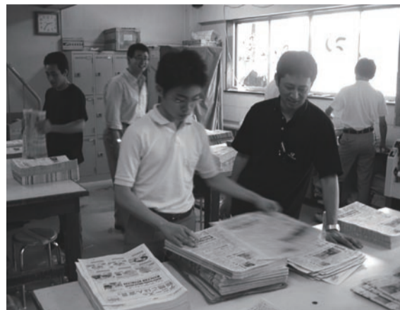
ASAニュータウン永山店にて 多摩市永山 2-19-1 tel 042-374-3411

7月12日(水)午後2時、永山店に集まってくれた多摩大学附属聖ヶ丘中学の3年生、“新聞販売店ってどんなところ?”“新聞はどうやって自分の家まで届くの?”、素朴な疑問を胸に、30種類以上の職種の中から、第一希望でこの仕事を志願してくれた男子5名が体験する初めての「新聞配達」…2:30夕刊が到着、2:50、第2・第4水曜に折り込む夕刊冊子『マリオン』をセット。配達準備を整えて担当エリアに移動。バイクに積まれた新聞を一部づつポストへ…配達カードを入念にチェックする眼差しは真剣そのもの!“最後に新聞が一部余ってすごく焦った。”“かなり責任感がある仕事。”“バイクのカゴが空になった時は達成感があってうれしかった。”etc…思い思いの感想を書き留めてもらい5:00解散。雨が降らなくてヨカッタ。今度は朝刊にもトライしてみてください。今日はおつかれさま、そしてありがとう! (所長&スタッフより)